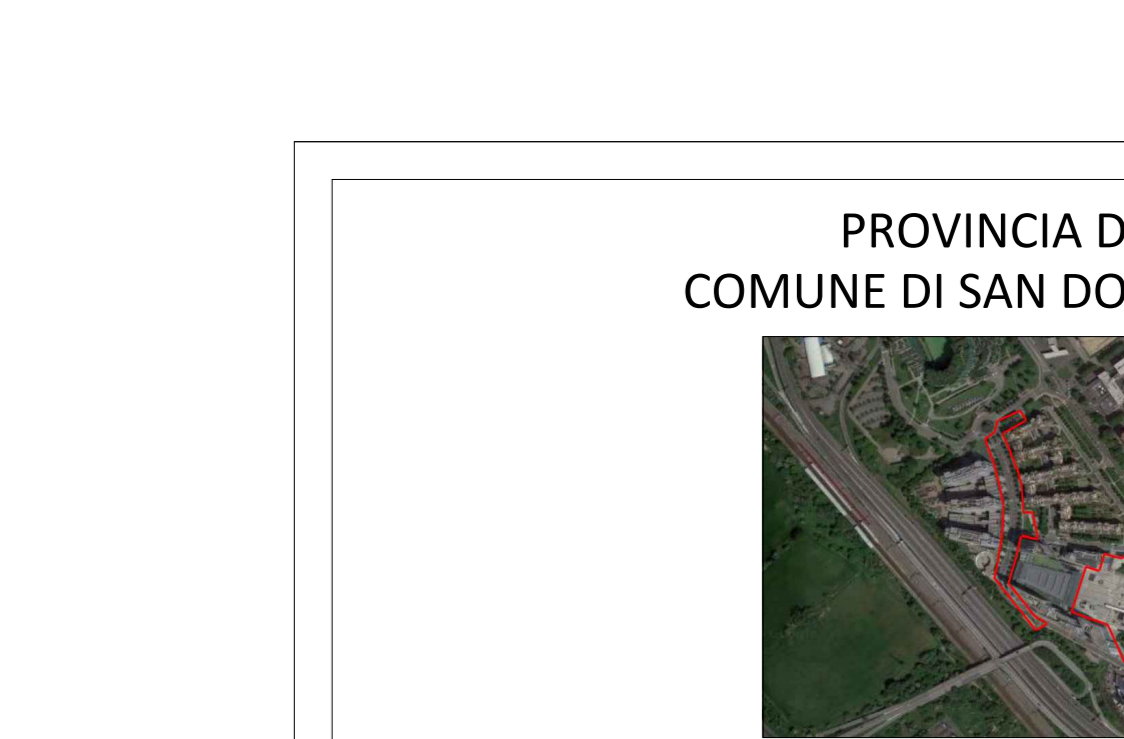
KEY PLAN SCALA nessuna